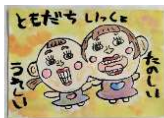
【天草白い雲の会会長賞】