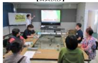
【本人部会：意見発表】