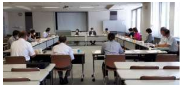
【臨時評議員会(9月開催)】