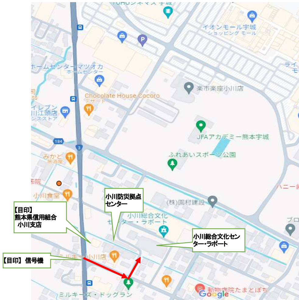
小川総合文化センター・ラポート配置図