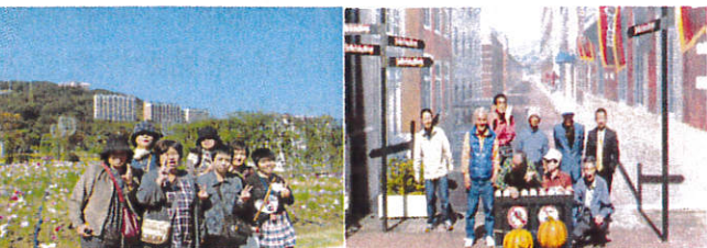
オランダの街並みの中で

晴天に恵まれ 10月19日、バス で出発。異国情 緒に満ちたハウステンボスに到着。運河 を船で移動し、散策を楽しみワンピ のグッズを買い、本場のピザを食べたり 。夜は平戸の温泉でくつろぎ、歌自慢、 歌姫の紅白カラオケ合戦。園長とご家族 の厳正な審査の結果、両者の熱唱に引き 分け。 二日目は水族館「海きらら」見学。様々 な珍しいクラゲに驚いたり、元気なイル カショーに拍手喝采。中華料理の昼食後、 長崎おみやげを手に無事帰園した。