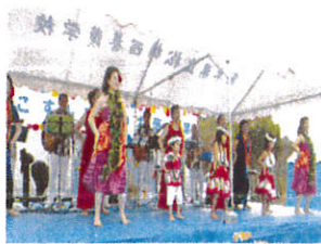
ハワイアンダンス

ランティアの皆さん、協賛いただいた関係各社、そして来場いただいた皆さんありがとうございました。