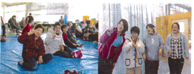
みんな笑顔いっぱい

12月8日、作業棟にステージをつくり、皆でカラオケを楽しみました。自慢の歌を熱唱!!ノリノリで踊る人もいて大盛り上がり。バイキング形式の昼食もいただき、お腹いっぱい、幸せいっぱいの日を過ごすことができました。