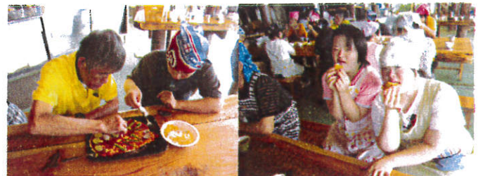
好きにトッピング!!