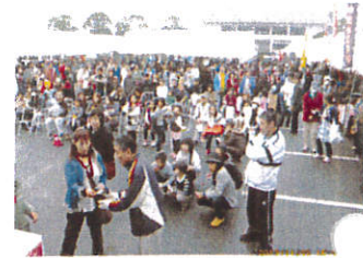
毎年抽選会は大賑わい