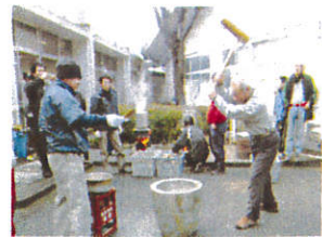
おいしいもちができるぞ

12月22日、今年最後のイベント、もちつき大会を行いました。威勢のいいかけ声とともに「ぺったん、ぺったん」。縁起物なので、皆で交替してつきました。あんこ餅や白餅を作り、つきたてのお餅を1個ずつ食べました。鏡餅も作ったので、これでお正月の準備は整いました。