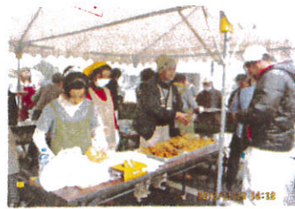
やきとりは大忙し

11月23日、こすもす秋の大感謝祭を開催しました。当日は小雨が降ったりやんだりのあいにくの天気でしたが、ステージにテントを張るなどしてどうにか野外で開催できました。熊本学園大学あすなろう、NECロジスティクス、その他個人で賛同いただいたボ