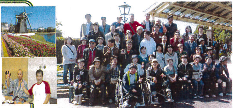
とてもいい天気でした 笑顔いっぱい!

晴天に恵まれ 10月19日、バス で出発。異国情 緒に満ちたハウステンボスに到着。運河 を船で移動し、散策を楽しみワンピ のグッズを買い、本場のピザを食べたり 。夜は平戸の温泉でくつろぎ、歌自慢、 歌姫の紅白カラオケ合戦。園長とご家族 の厳正な審査の結果、両者の熱唱に引き 分け。 二日目は水族館「海きらら」見学。様々 な珍しいクラゲに驚いたり、元気なイル カショーに拍手喝采。中華料理の昼食後、 長崎おみやげを手に無事帰園した。