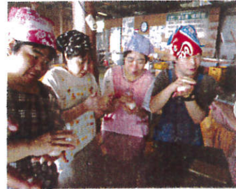
ピザ生地を作ります

9月15日三角の宮田農園へ。ピザやチョコパン作りなどに挑戦。ピザのトッピングは個性が現れます。初めて参加される方もいてとても楽しんでいました。皆さん、お互いに協力したり助け合ったりしていたのがとても印象的な一日でした。