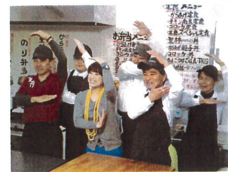
みんなでランキンQ

ブログ http://mypage.ameba.jp/#!/stream/now Facebook http://www.facebook.com/matubasehollywood