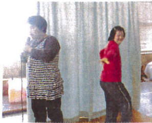
ノリノリでダンス♪

12月8日、作業棟にステージをつくり、皆でカラオケを楽しみました。自慢の歌を熱唱!!ノリノリで踊る人もいて大盛り上がり。バイキング形式の昼食もいただき、お腹いっぱい、幸せいっぱいの日を過ごすことができました。