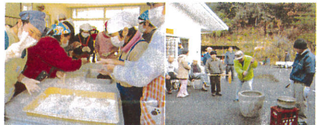
きれいに丸めるよ おいしいもちになーれ

12月22日、今年最後のイベント、もちつき大会を行いました。威勢のいいかけ声とともに「ぺったん、ぺったん」。縁起物なので、皆で交替してつきました。あんこ餅や白餅を作り、つきたてのお餅を1個ずつ食べました。鏡餅も作ったので、これでお正月の準備は整いました。