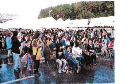
抽選会たくさんの方が集まりました