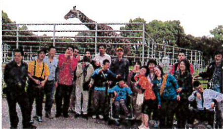
キリンの前でポーズ