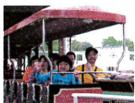
トロッコもいいね

10月〜口通所部で動植物園へ。ゾウやキリンにテンションも上がります。いくつになっても楽しんで心が癒されます。「初めて観覧車に乗った」