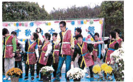
利用者の方もマルモリなどダンスを披露

11月23日、熊本こすもす園の一大イベント「こすもす秋の大感謝祭」が開催されました。当日は朝から雨が降り、カップを着ての準備となりましたが、徐々に雨が上がり、昼ごろには太陽も顔を出す、いい天気になりました。 たくさんのお客さん、出演者、協賛・ボランティアの皆さん、家族の会の方々に支えられ、大盛況となりました。そして、祭のために一生懸命各係の仕事を頑張った利用者の方々のたくさん笑顔もあり、とても素敵な祭となりました。