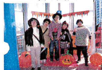
ハロウィンだよー