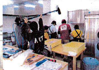
テレビにも出ました