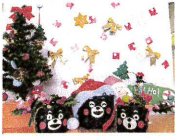
くまモンもクリスマス