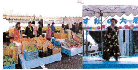
バザーにステージ大盛り上がり

11月23日、熊本こすもす園の一大イベント「こすもす秋の大感謝祭」が開催されました。当日は朝から雨が降り、カップを着ての準備となりましたが、徐々に雨が上がり、昼ごろには太陽も顔を出す、いい天気になりました。 たくさんのお客さん、出演者、協賛・ボランティアの皆さん、家族の会の方々に支えられ、大盛況となりました。そして、祭のために一生懸命各係の仕事を頑張った利用者の方々のたくさん笑顔もあり、とても素敵な祭となりました。