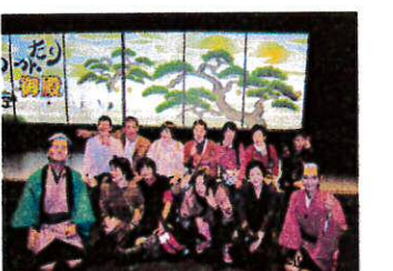
江戸時代へタイムスリップ

11月1日〜2日に第二陣33名で熊本阿蘇旅行に行ってきました。 一日目は、熊本城・本丸御殿や天守閣を見学。夜は阿蘇のホテルで宴会。くまモンのそっくりさん? も登場。 二日目は、阿蘇猿まわし劇場でかわいいお猿さんの芸を見て歓声を上げ、阿蘇中岳火口では自然の壮大さを感じ帰ってきました。いつでも行けそうでなかなか行かない県内の名所を巡り再発見の旅でした。