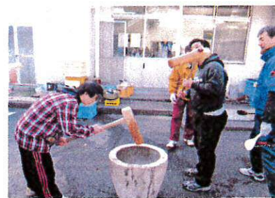
おいしいお餅にな〜れ!