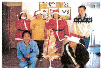
サンタになったよ