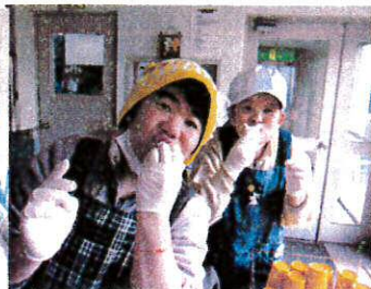
ほっぺがお餅みた〜い