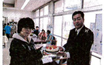
ケーキありがとうございます

12月19日〜26日、こすもすクリスマス週間期間中に、クリスマス会、バイキング、ヤマザキ製パンさんからのケーキ贈呈式などイベントがありました。 介護棟のクリスマス会ではピザやケーキを作り楽しみました。 また、ヤマザキ製パン従業員組合熊本支部さんより素敵なクリスマスケーキをいただき、皆でおいしくいただきました。季節の行事は、ワクワク心が躍りますね。