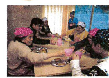
みんなでカンパニー!