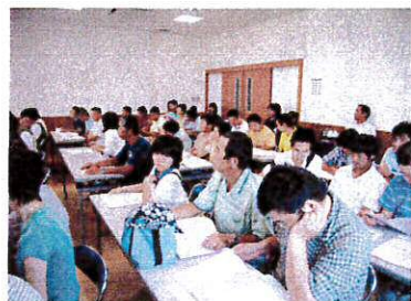
相談会の様子 一生懸命話を聞きました

伝統工芸体験は、伝統工芸品の「木の葉猿」の中の「めしきいざる」作りに挑戦しました。窯元の先生やボランティアの方に教えてもらいながら、思い思いの個性あふれるめしきいざるができてきました。焼きあがって送られてくるのが待ち遠しいです。