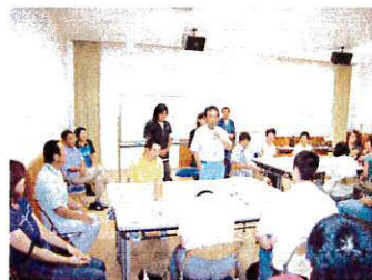
一日の感想を 発表しました