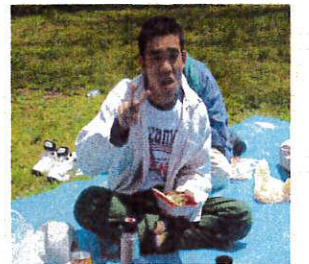
お弁当おいしかったよ〜