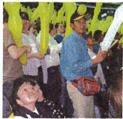
風船飛ばし! 何故だか1人白い風船!?