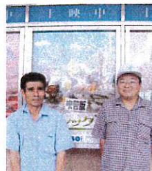
映画楽しかったなー

4月から2名の方が新たに自活訓練を開始しました。地域の中の借家を利用し、自立に向けて、食事作りや社会生活、余暇活動などの訓練に取り組んでいます。最初は、慣れないことばかりで戸惑うことも多かった2人ですが、約4ヶ月経過して少しずつ上達し、訓練の成果がでてきています。今後も利用者の方のニーズに对应し、地域生活がより充実したものと自活訓練に取り組んでいきます。