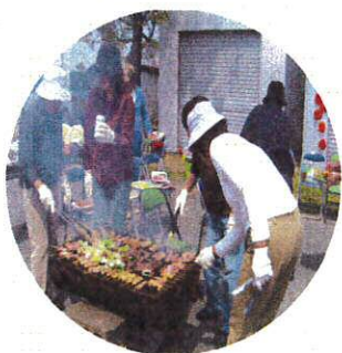
家族の皆さんありがとうございました

3月31日、お花見と送別会を行いました。送別会は、グループホームに入る2名と通所に移る1名で、いつでも会えることもあり、笑顔での激励会といった雰囲気でした。満開の桜の木の下でビール・ジュースを片手にバーベキューを楽しみました。家族の皆さんもお手伝いに来て盛り上げてくださりありがとうございました。