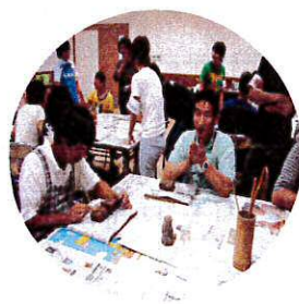
土を扱うのはなかなか 難しいな～