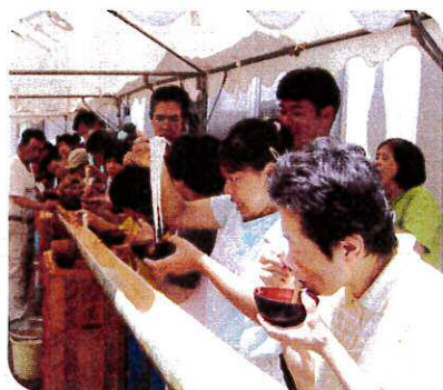
たくさんつかめたぞー