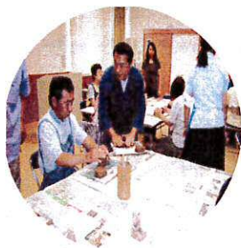
窯元の先生に 直接習いました