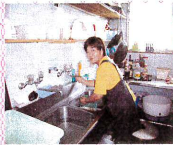
飲食店で食器洗いをします

5月半ばより、割烹「花道」にて職場実習に行っており、皿洗いや食事の盛りつけなどを行っています。今は午前中4時間の仕事ですが、慣れてきたら、一日仕事ができるようになってほしいなと思っています。来年、グループホーム移って地域の中で生活するのが夢です。