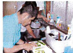
包丁の使い方上手になってきたよ