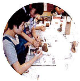
ボランティアの方に 手伝ってもらいました