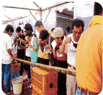
上手につかめるかなー