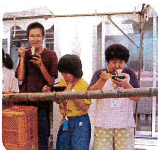
夏はやっぱりそうめん!