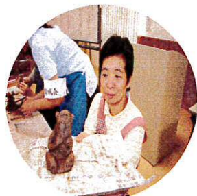
かたいくできたでしょ!