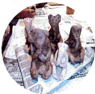
「めしきいざる」完成! 見本はいくつあるかな?