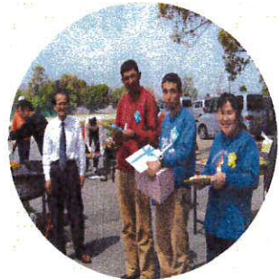
ちょっぴり緊張しながら最後のあいさつをしました