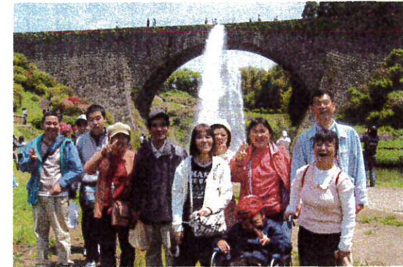
放水のしぶきを浴びながらみんな笑顔!