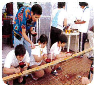
下流でのんびり食べよう

8月10日、こすもす園夏の恒例行事「納涼そうめん流し」を行いました。流れてくるそうめんを逃さないようにつかみ口の中へ。竹の香り漂う中、みょうが、しそなど好きな薬味をトッピングし、冷たい水とともに流れてくるそうめんをおいしくいただきました。