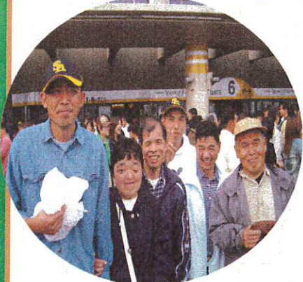
グループホームの仲間とヤフードームへ野球観戦!