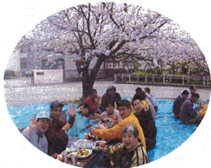
満開の桜の木下で!