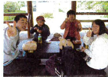
みんなで一緒に ランチタイム