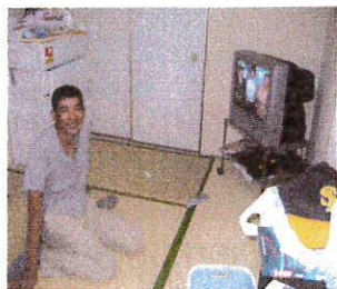
グループホームIIIの様子

これから、利用者本人の希望と、ご家族の意向の最終的な確認をしたいと考えておりますので、当事者の皆様には、ご理解とご協力をよろしく願います。