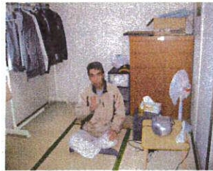
4月から入居グループホームⅢ ずいぶん慣れました