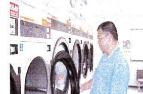
コインランドリーにも行ってみました