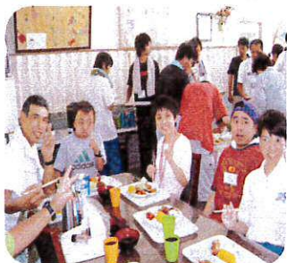
そうめんの後は食堂でバイキング

8月10日、こすもす園夏の恒例行事「納涼そうめん流し」を行いました。流れてくるそうめんを逃さないようにつかみ口の中へ。竹の香り漂う中、みょうが、しそなど好きな薬味をトッピングし、冷たい水とともに流れてくるそうめんをおいしくいただきました。