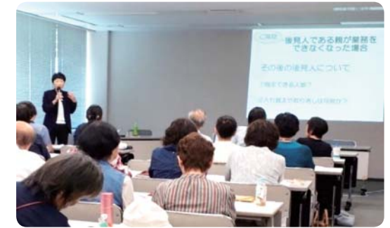
講話「成年後見人制度」

地域で生活している障がいのある人々に適切な支援や相談ができるよう、県内の知的障害者相談員と生活協力員を対象に研修会(年1回)を開催しています。